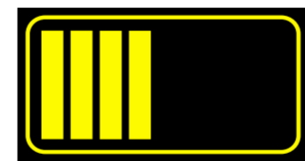
Leitender Branddirektor Leitende Branddirektorin