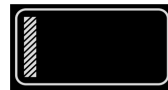
Brandoberinspektoran- wärter, Brandoberinspek- toranwärterin im 1. Ausbildungsjahr