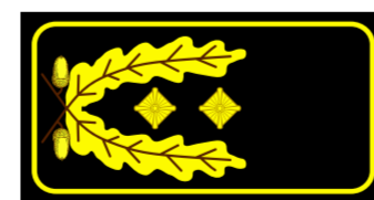
Ständiger Vertreter des Landesbranddirektors Ständige Vertreterin des Landesbranddirektors