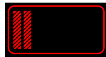
Brandmeisteranwärter Brandmeisteranwärterin nach 1. Ausbildungsjahr