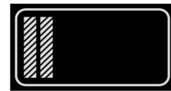
Brandoberinspektoran- wärter, Brandoberinspek- toranwärterin nach 1. Ausbildungsjahr