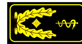
Abteilungsleiter Ärzt- licher Leiter Rettungsdienst Abteilungsleiterin Ärzt- liche Leiterin Rettungsdienst