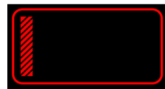
Brandmeisteranwärter Brandmeisteranwärterin im 1. Ausbildungsjahr